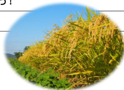
【秋空とたわわに実ったコシヒカリ】