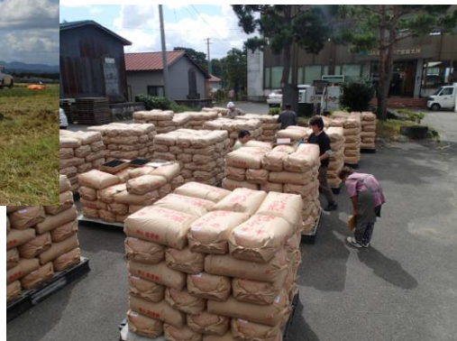
↓ 農協での等級検査